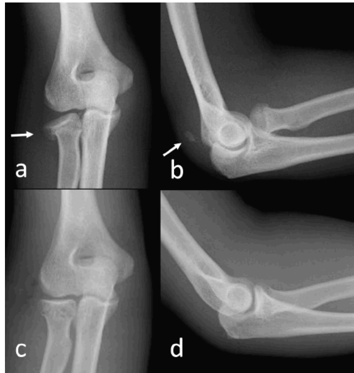
図2 症例2 単純X線像